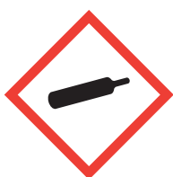
Je suis sous pression