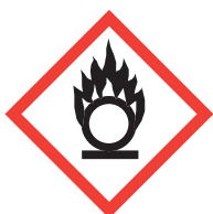
Je fais flamber