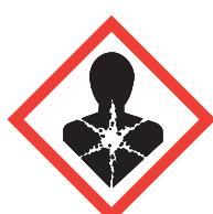
Je nuis gravement à la santé