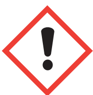
J'altère la santé ou la couche d'ozone